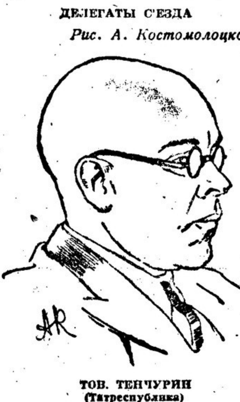
Рис. А. Костомолов